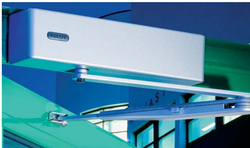
Uksesulgur DC240 koos lahtihoidmisseadme 7191'ga

ABLOY® ukksesulgurid töötavad laias temperatuurivahemikus, mis tä-